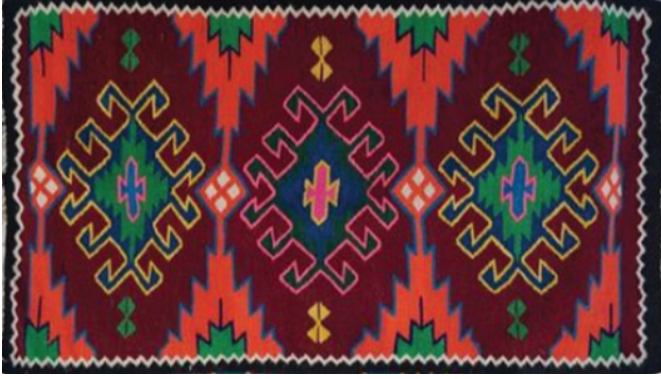
Resim 2: Yörük Dokumasından Örnek.

Yörük kültüründeki dokumaların desenleri, genellikle geometrik şekillerden oluşur. Bu desenler doğada bulunan şekillerin, hayvan figürlerinin ve günlük yaşamın bir yansımasıdır. Yörük halılarında ve kilimlerinde kullanılan motifler, sembolik anlamlar taşır ve bu desenler bir anlamda ailenin veya toplumun kimliğini belirler (Oyman, N.R.2019 ; Uğurlu, A., & Uğurlu, S. S. 2022).