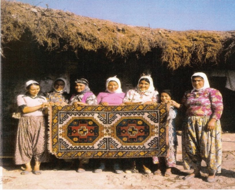
Resim 1: İlk DOBAG halısı, 1982.

1982 yılından itibaren gerçek anlamda halılar üretilmeye başlanmıştır (Resim 1). Kaliteli yün, doğal boya, gerçek desenler ve renklerle halıların dokunmasına hız verilmiştir. Dokunan halıların kaliteli olması ve yurt dışı pazarında yerini alması için halıların dokuma sırasında denetlenmesi gerekmiştir. Bu kontroller fakülte elemanları tarafından yürütülmüştür.