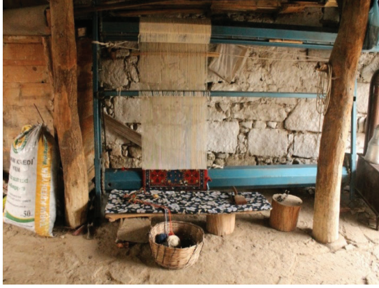
Resim 7: Çözü sarmalı metal tezgâh, Ayvacık, 2015 (Mine Taylan Arşivi).

Belirtildiği gibi çözgü tezgah üzerinde çözülmez. Bunun için çözgünün uzunluğuna bağlı olarak yere karşılıklı iki kazık çakılır. Fakat kazıklar çözgünün bitimine doğru dik durmadığından birbirlerine doğru eğim yaparlar. Bu durum çözgü tellerinin eşit uzunlukta olmaması ile sonuçlanarak dokumanın yapısını bozar. Bu yüzden DOBAG Projesi'nde çözgü için uzun bir prizma şeklinde ahşap veya metal olan bir aletin kullanımı tercih edilmiştir. Dokunacak halının boyundan 1 m fazlalık hesaplanarak hazırlanan çözgü tezgaha geçirilmeden önce, iki ucundan ince çubuklara geçirilmektedir. Çözgü hazırlama işlemi için birkaç kişinin birlikte çalışması gerekmektedir. Komşular bir araya gelerek dokumanın enine göre çözgü tellerini yayarlar ve düzene sokarak tezgaha taşırlar. İnce çubuklar alt ve üst leventlere yerleştirilir ve çözgü tellerinin düzgün gerilmesi ve yan yana eşit dağılması sağlanarak leventlere sarılır. Çözgü telleri kırışık kalmaması için gerdirerek birkaç defa alt ve üst levende sarılması gerekmektedir. Çözgü tezgaha geçirildikten sonra gücü işlemi yapılmaktadır. Gücü, seçilmiş çözgülerin öne ve arkaya getirilmesini sağlayan mekanik bir düzenlemedir. Bu işlem sayesinde atkının içinden geçeceği ağızlık oluşturulur. Seçilen çözgülerin her 10 santimetrede eşit sayıda olması için gücü sopasına çivi çakılarak mesafe belirlenir.