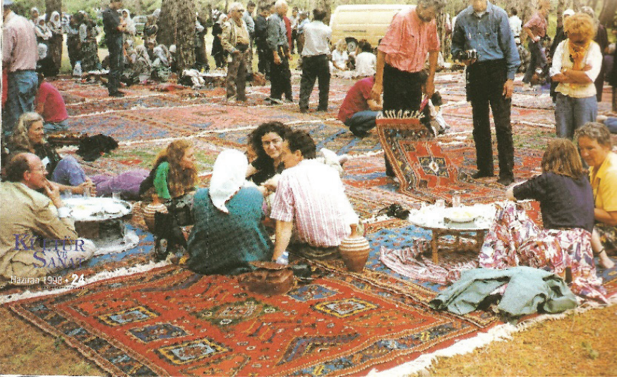
Resim 12: DOBAG halı sergisi (Asher, 1998:24).

DOBAG halılarının dünyanın çeşitli yerlerinden alıcıları olmuştur. Halılarda geleneksel yapının tamamı ile korunuyor olması ve üretiminde kullanılan doğal boya, yabancı müşterilerin ilgisini çekmiştir. Müşteriler satın aldıkları halıları ülkelerindeki galerilerde satışa sundukları gibi, yaşadıkları evleri için de satın almışlardır. DOBAG müşterileri, kültürlerin korunmasına ve devam ettirilmesine destek veren yapıda olmuştur. Bu bilincin hali hazırda var olmasının yanı sıra, uzmanların katılımı ile gerçekleştirilen konferanslar, dokuyucuların bu konferanslardaki dokuma gösterileri ve sergiler, DOBAG halılarına ilgiyi artırıcı yönde olmuştur. Her halıya Marmara Üniversitesi, Güzel Sanatlar Fakültesi tarafından verilen garanti etiketi, yabancı müşterilerin güvenle alışveriş yapmasını sağlamıştır. Daha önce belirttiğimiz gibi; müşteriler kooperatiflere gelerek de halı alımını gerçekleştirmiştir. Ayrıca sipariş doğrultusunda da üretim yapılmıştır. Amerika'dan gelen bir yolluk siparişi, evlerin büyük olması dolayısı ile 8 m uzunluğu bulmuştur. Yine Oxford Collage için 36 m 2 'lik ve British Museum, Islamic Gallery için 27 m 2 'lik halıların dokunmuş olması, yabancı müşterilerden alınan büyük ebatlı halı siparişlerine örnektir (Resim 13).