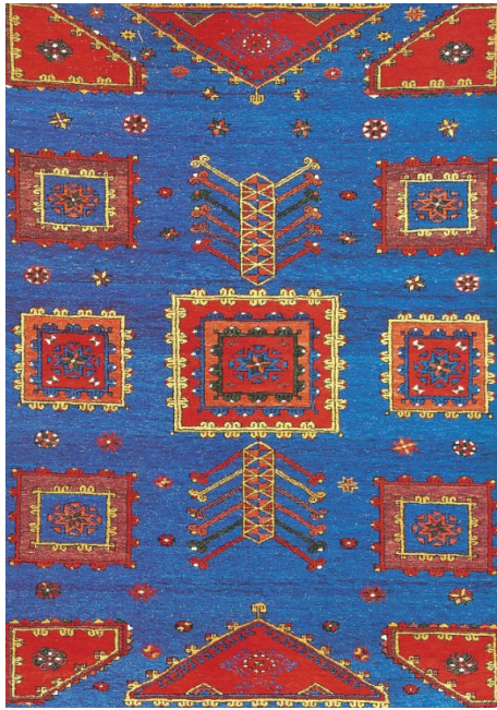
Resim 4: Altıntabak desenli DOBAG halısı (Akova, 2005:26).