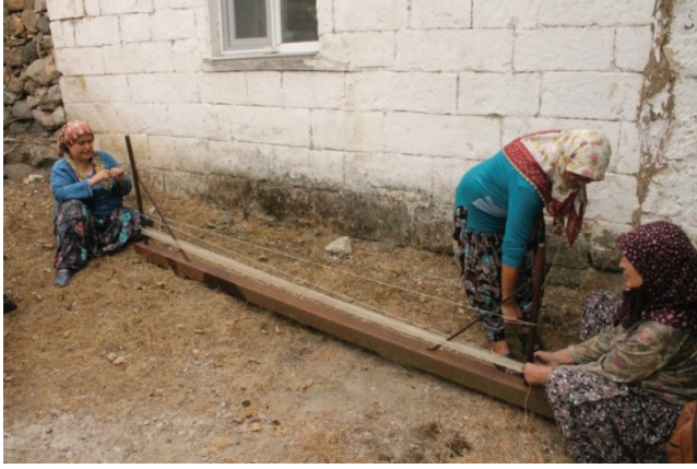
Resim 8: Dokuyucu kadınlar çözü hazırlarken, Ayvacık, 2015.

Gücünün ardından, çözülerin eşit aralıklarla sıralanması için çiti yapılmaktadır. Çiti aynı zamanda atkılarının halının kullanımı sırasında açılmasını önler (Resim 9). Çitiden sonra havlı kısma geçmeden önce istenilen yükseklikte kilim dokunur ve her iki bölge için de karakteristiktir. Bu bölüm tek renk olabildiği gibi, şeritler halinde farklı renklerde ya da çeşitli desenlerle süslenerek dokunabilmektedir.