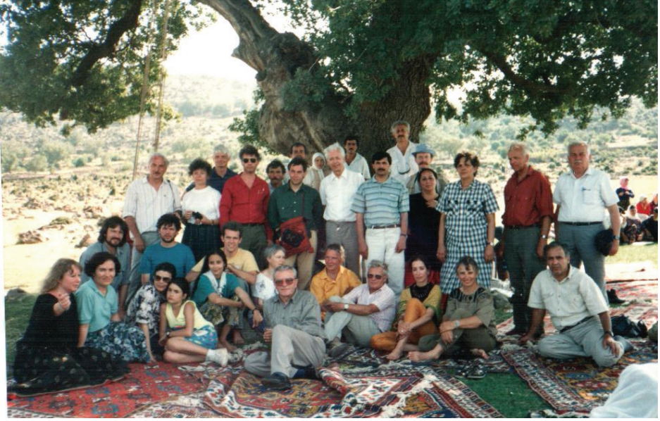
Resim 11: 1991 yılında Ayvacık'ta düzenlenen Uluslararası DOBAG Sempozyumu katılımcıları.

Yurt dışındaki DOBAG müşterilerinin de tanıtım ve pazarlama etkinlikleri olmuştur. Yılın belli dönemlerinde DOBAG dokuyucuları ve projede yer alan personelin de katıldığı halı sergileri düzenlenmiştir (Resim 12). Bu sergilerde projeyi tanıtmaya amacı ile dokuyucular tarafından geleneksel halı tezgahında dokuma gösterisi yapılmış, DOBAG ekibinde yer alan personel ise konferans vermiştir. DOBAG halılarının koleksiyonlarına girdiği uluslararası müze ve kuruluşların isimleri şu şekildedir: National Museum of Ethnology, Osaka, Japonya (1985), British Museum (Islamic Gallery), Londra, İngiltere (1989), De Young Museum of Artisan Art, San Francisco, A.B.D. (1990), All Souls Collage, Oxford University, İngiltere (1992), Victoria and Albert Museum, Londra, İngiltere (1994), Academy of Science, San Francisco, A.B.D. (1997), Museum fuer Völkerkunde, Viyana, Avusturya (1997), National Museum of Scotland (NMS), Edinburg, İskoçya (1997), Museum of Ethnology, Sandane, Norveç (2000), Museum of Asian Arts, Singapur (2001), California Academy of Science, A.B.D (2001).