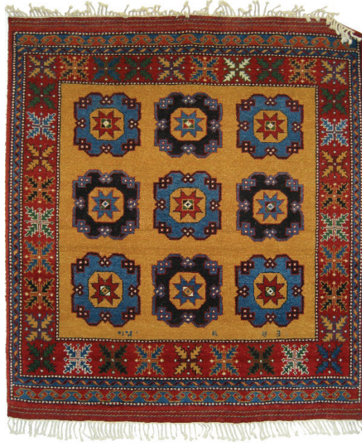
Resim 2: DOBAG Projesi kapsamında dokunmuş küçük desenli Holbain halısı.

Gülü Ayvacık bölgesinin başlıca desenleri arasındadır (Resim 3 ve Resim 4). Yundağ bölgesinin desenleri ise; Sandıklı, Sandıklı Çiçek ve Vazoselvidir (Resim 5). Bordürde kullanılan bir motif aynı zamanda zeminde de kullanılabilmektedir (Resim 6). Ayvacık ve Yundağ bölgelerinde bordürlerde görülen ortak motifler çiçek, yaprak ve sığır sidiğidir. Ayvacık bölgesinde görülen başlıca bordür motifleri baklava kesiği, yıldız, kocabaş, çift kollu su, üzüm su, yarım makas, tam makas, büyük s, kilit su ilen, Yundağ bölgesininkiler ise kazankulbu, urgan, bıçak ucu ve Çin bulutu motifleridir.