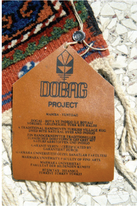
Resim 14: DOBAG garanti etiketi (Atlıhan, 2008:30).

Müşteri bu etiket ile projenin arkasında üniversite güvencesi olduğunu görmüştür. Garanti etiketi, halıların gerçek değerleri karşılığında satışını sağlaması açısından oldukça önemlidir. DOBAG etiketi deridir ve Marmara Üniversitesi, Güzel Sanatlar Fakültesi üzerine tescillidir. Etiket hazırlanmış her halının bir de kimlik kartı bulunmaktadır. Kimlik kartında; dokuyucunun adı ve fotoğrafı, halının dokunduğu bölge, köy, ilmek sayısı, boyutları ve garanti etiketi numarası bulunmaktadır (Resim 14).