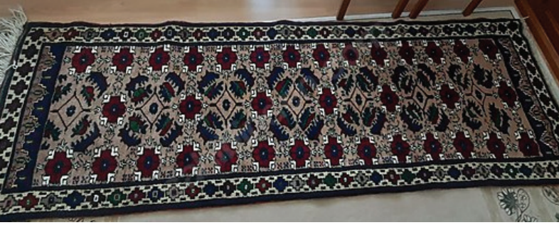
Resim 2: Yörük Dokumasından Örnek (www.muglapostasi.com.tr E.T:15.11.2024).