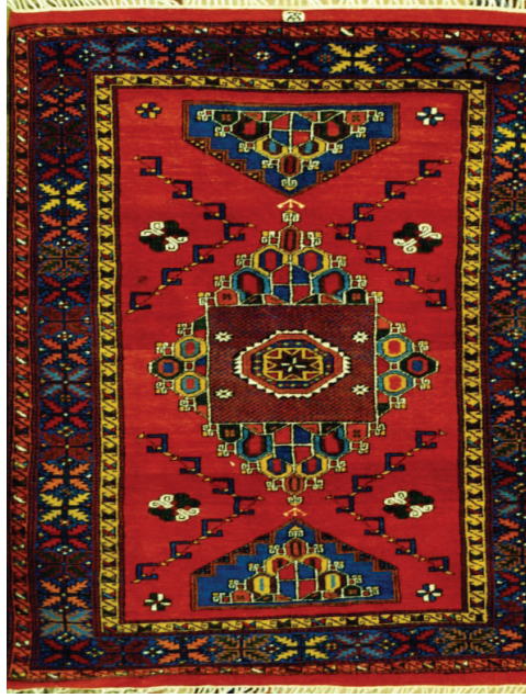
Resim 3: Turnalı desenli DOBAG halısı.