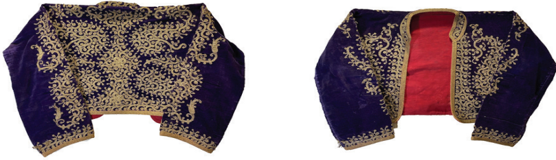
Resim 3: Mor Cepken Örneği.