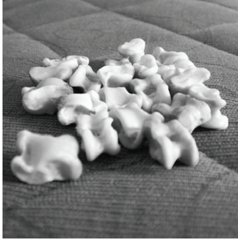
Şekil 1. Aşık Kemiği