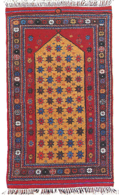
Resim 6: Zemini yıldız motifli bir DOBAG halısı (Akova, 2005:23).