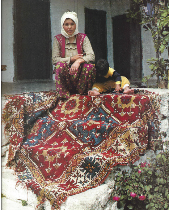
Resim 5: Sandıklı Çiçek desenli DOBAG halısı (Peterson, 1991:5).